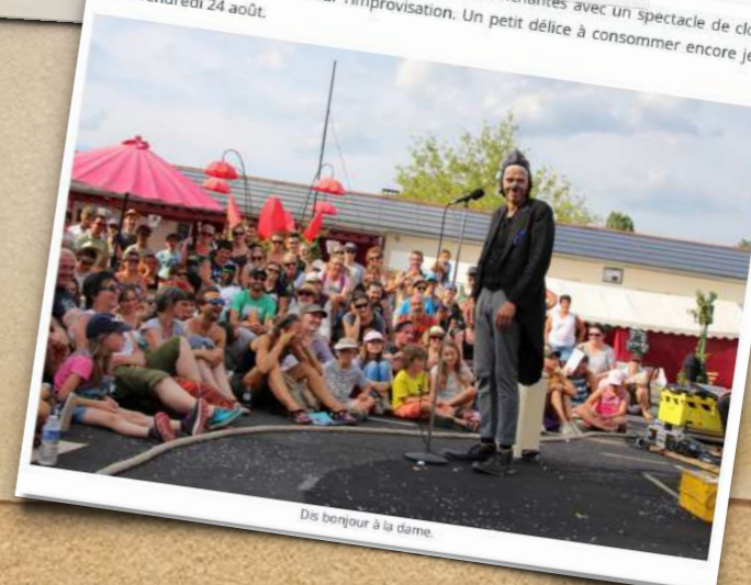
Dis bonjour à la dame

La compagnie Dis bonjour à la dame, nous a aussi enchantés avec un spectacle de clown, mettant habilement l'accent sur l'improvisation. Un petit délice à consommer encore jeudi 23 et vendredi 24 août.