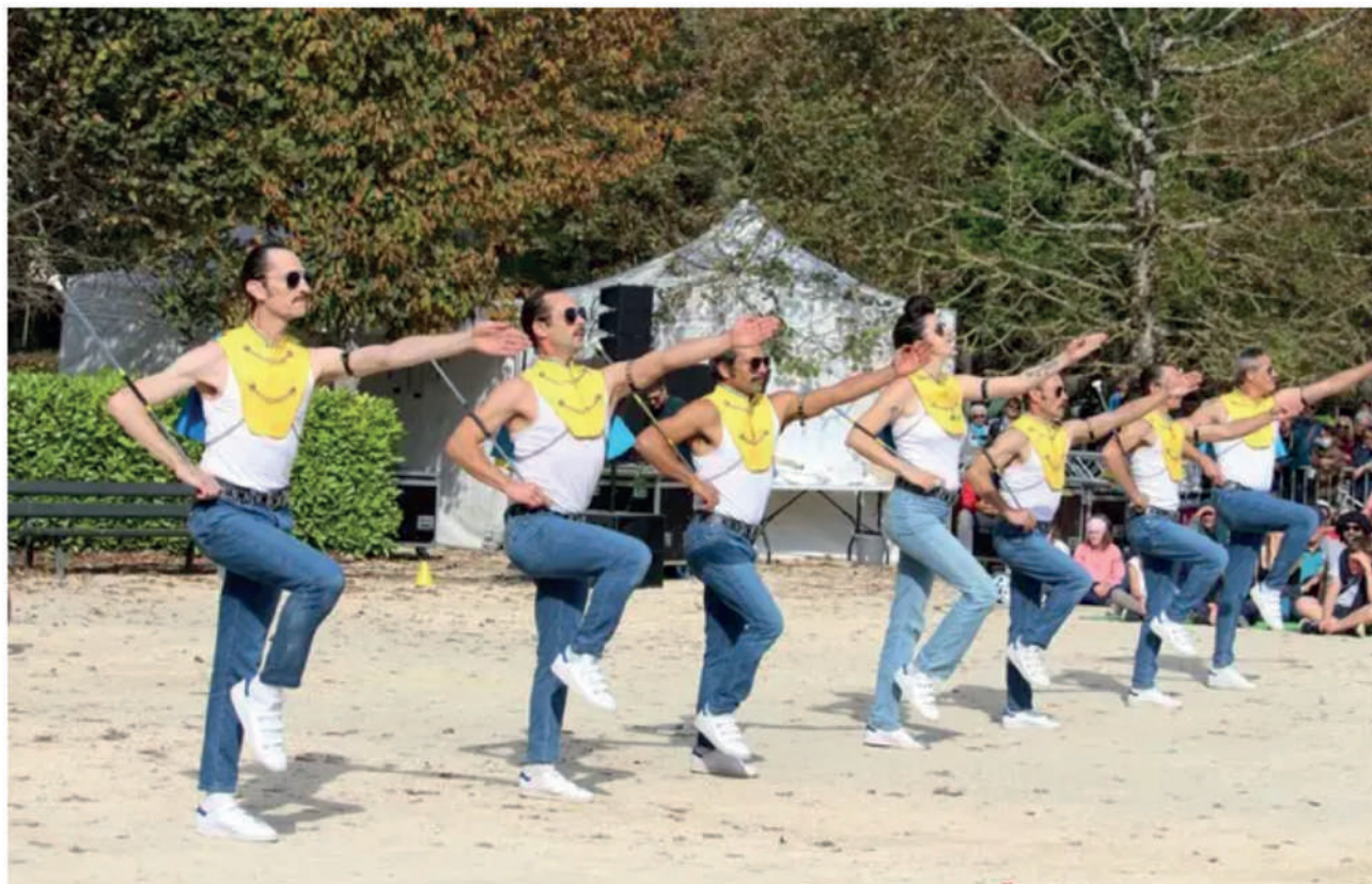
Les Queen A Man repartent pour une deuxième tournée en 2022. Certains rêvent d'une représentation à Londres ou même au festival de métal, le Hellfest.

une parodie. J'ai toujours voulu que ce soit un hommage, avec de la drôlerie ». Farrokh Bulsara, nom d'origine du chanteur de Queen, aurait certainement apprécié cette audace. « C'est super de voir des hommes qui osent comme ça ! Tu n'imaginerais pas les voir faire de la majorette et se transformer en Freddie Mercury quand tu les regardes. » Cécile Le Guern et son équipe remplissent pour une deuxième tournée à partir d'avril prochain. « On peut se dire qu'à l'origine, c'est un peu barge de partir à huit avec des gars qui n'ont jamais fait de majorette. Il y a un contre-pied de plein de choses ».