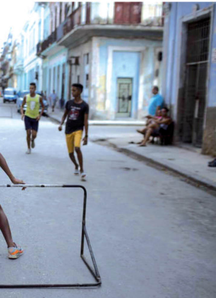
Streetfootball - CUBA

Les 14, 15, 16 e arrondissements de Marseille ne figuraient pas sur le plan que nous avions à la maison.