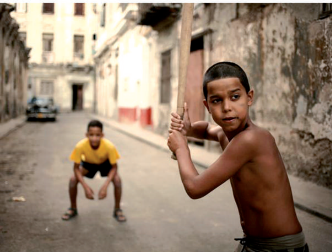
Baseball - LA HAVANE, CUBA

Je veux trouver des matières et des états de corps avec tous ces mots pour Vous êtes ici.