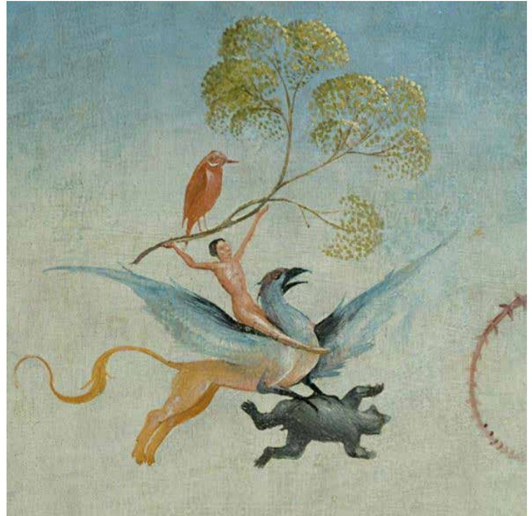
Le Jardin des délices, Jérôme Bosch

Le spectateur voyage d'une émotion à l'autre, il arrive qu'il fasse la curieuse expérience respiratoire d'éprouver simultanément des états ordinairement incompatibles. »